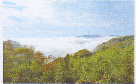
高梁市松原からの雲海(雲の下は成羽) 2019.11.22 / 9:00