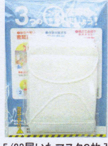
5/23届いたマスク2枚入

話題の主役はゆずった感のある「アベノマスク」が5月23日、我が家(岡山市)にも届いた(写真右)。一時市内の店頭から消え、価格も高騰、「マスクパブル」といわれた。それも5月に入ると異業種の店先に山積みされ、価格も大幅値下げとなっていた。菅官房長官は5月20日の見解を表明、「品薄改善に効果があった」のは政府の布マスクの始まったことで市中のマスク需要が抑制されたからという。