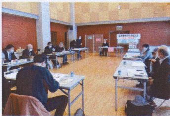
会場の外は一面白銀の世界、広い会場に、換気と参加者を限って距離をとりながらも熱心に協議!!

「お詫びと訂正」先月本紙コラムでリュウグウの大きさ500mと書きましたが、早速読者から連絡が入り約900mに訂正します。でもどうやって分かるの?教えて!