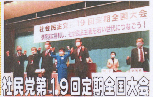
社民党第19回定期全国大会

憲法が今最大の危機 参院選必勝を 会が3月19・20日、東京で開催。コロナ禍のためオンラインと会場の変則参加にそれでも「社民党が残つてよかった」という明るい雰囲気を感じた。大会1日目福島党首が挨拶、衆院選での全国の頑張りに御礼を述べたあと、ロシアのウクライナ侵攻に言及、「武力で平和はつくれない」と強く抗議。また日本の核武装発言を批判、原発への戦火をとらえ原発と核兵器の廃絶をも強く訴えた。さらには憲法が今最大の危機と強調