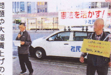
マイクを持つ宮田代表と手作りプラスターを掲げる参加者たち

問題や大幅賃上げの必要性を取り上げた。自己責任の新自由主義ではなく共に暮らしていける社会に向けて「がんこに平和・くらしが一番」の政治に変えようと訴えた。さらに臨時国会の所信表明で所得税減税を打ち出したが財源の説明はなく、軍拡増税との整合性に疑問符を付けた。