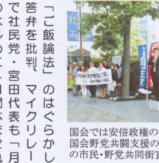
国会では安倍政権の数の横暴が続く中、国会野党共闘支援の世論が力にと、毎月の市民・野党共同街宣続く(5月26日)